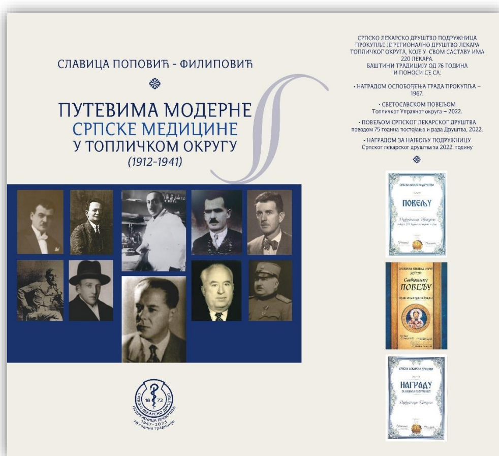
Предња корица књиге са клапном